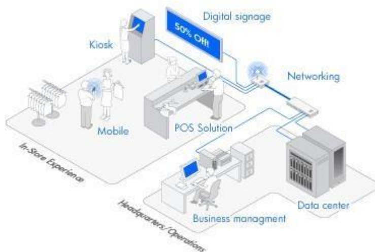
Figure 1 POS System

POS System 이란 판매와 관련한 데이터를 일괄적으로 관리하고, 고객정보를 수집하여 부가가치를 향상시키는 시스템이다. 본 프로젝트는 전체 POS System 중 POS 단말기 만 을 대상으로 구현하 는 것으로 규모를 제한한다. 모든 시스템은 SW 만으로 구현 하고 HW 가 필요한 부분은 SW 모듈을 만들어 가상의 HW를 구현한다.