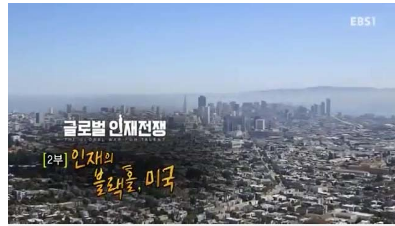
EBS 다큐프라임 글로벌인재전쟁 2부 인재의 블랙홀, 미국 170314